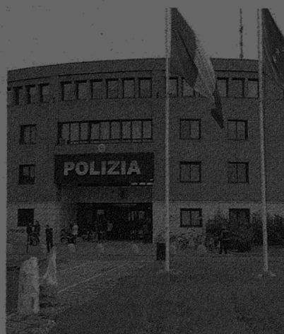
La sede della questura di Modena

rante delle politiche di coordinamento dell'azione amministrativa sul territorio, secondo criteri di collegialità e raccordo, e nel rispetto dei principi di leale cooperazione e di sussidiarietà. A tal fine si pone inol-