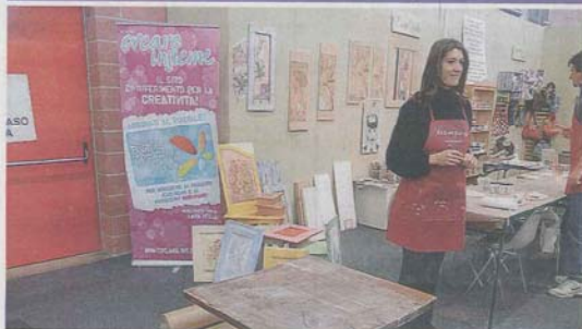
CURIOSA Alcuni momenti della mostra-mercato che si tiene in fiera. La terza edizione, che ha confermato il successo degli anni scorsi, si chiuderà oggi: padiglioni aperti dalle 10 alle 20