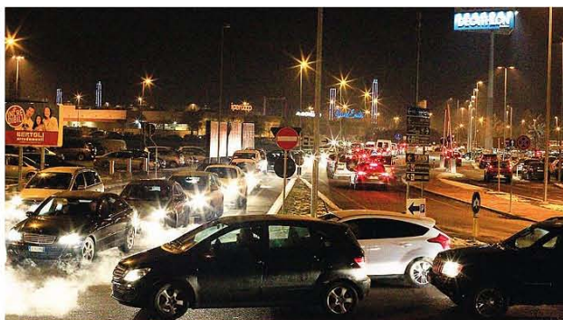
Traffico caotico ieri nella zona di Cittanova per l'apertura simultanea di grandi store e fiera