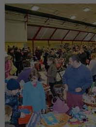
Tanti avventori al Palamolza

Dell'afflusso, anche da fuori provincia, ha giovato anche il Mercato straordinario nell'anello del Novi Sad.