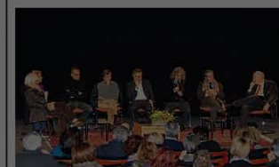
Un momento dell'incontro al Forum Manzani