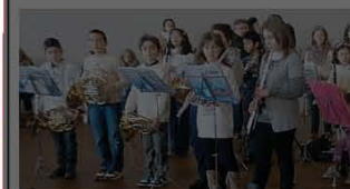
La festa per l'inaugurazione dell'aula