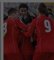
L'esultanza dei Carpi per il pari

L'Assicuratrice Milanese batte Crema al PalaPanini per 3-2 (24-26 25-18 18-25 25-22 15-6) dopo una partita molto sofferta. Inizio in salita per le Tigri sotto nel primo set. Successo nel secondo, ma nuovo svantaggio nel terzo. Altra rimonta e si va al tie break dominato dalla formazione di Cuello.